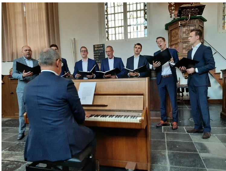
Mannenzanggroep In Zijn Liefde dienst 15 okt 2023

U geeft een toekomst vol van hoop Dat heeft U aan ons beloofd Niemand anders, U alleen Leidt ons door dit leven heen